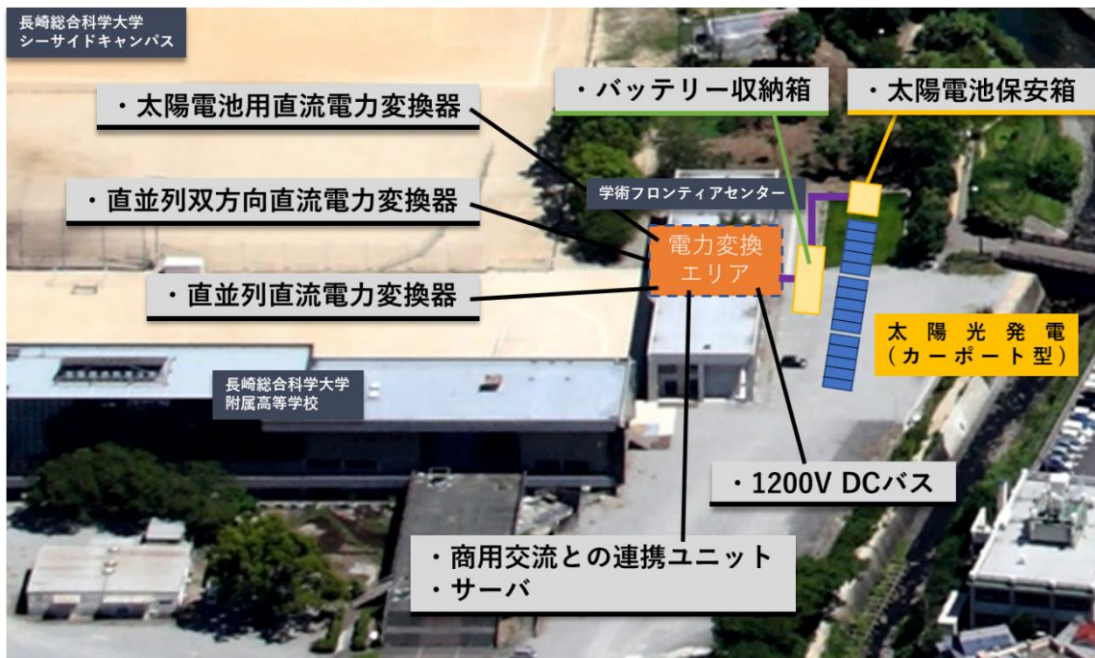
図. 長崎総合科学大学における実証実験